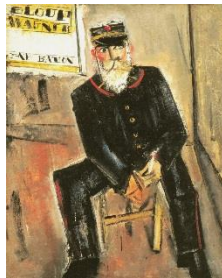
「郵便配達夫」1928年 大阪新美術館建設準備室蔵