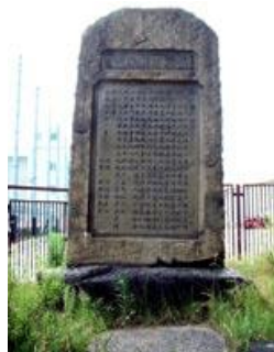
城東小学校にある 「鳴野古戦場碑」