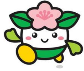
天王寺区 (てんのうじく) マスコットキャラクター 「ももてんちゃん」