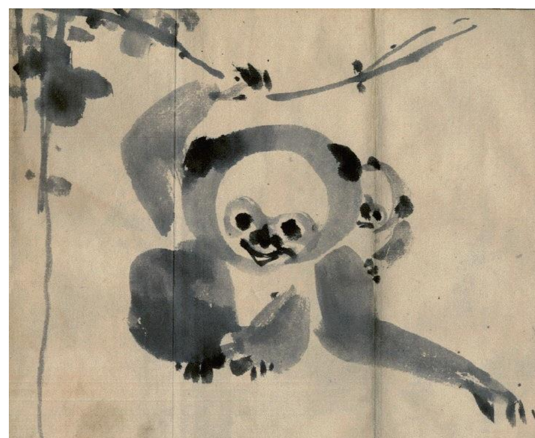
「法橋関月先生书画帖」一部改変