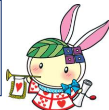
生野区マスコットキャラクターいくみん

むじ 無地のミニトートバッグに好きなモチーフを貼り付け、 せかいひと 世界に一つだけのオリジナルバッグを作ります。