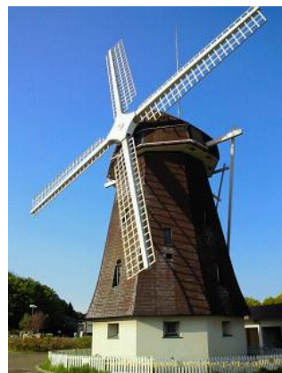
鶴見新山の風車の丘

「花博記念公園鶴見緑地について」(『大阪春 95号』大阪春秋社 1999) *ID 0000746464