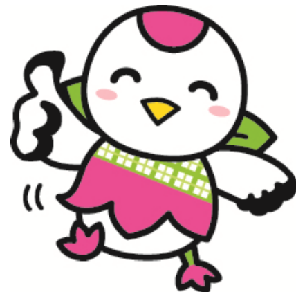
鶴見区マスコットキャラクター「つるりっぶ」

この調べかたガイドは、区ごとに2つのことがらを選び、それについて調べるのに役立つ図書館の本や、ホームページで見られる情報を、まとめたものです。