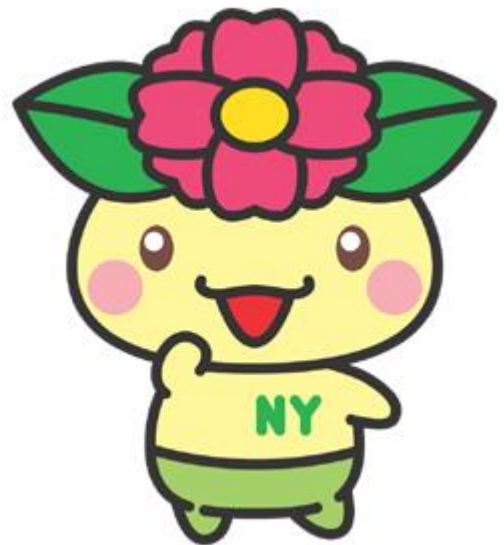
西淀川区のマスコット「こ〜よん」