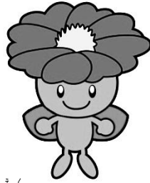
住之江区マスコットキャラクター 「さざびー」