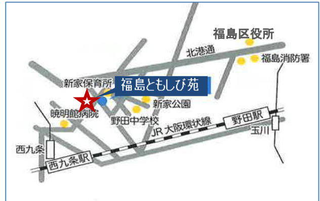
福島ともしび苑 大阪市福島区吉野 5-6-11 西九条駅から約500m、野田駅から約1Km