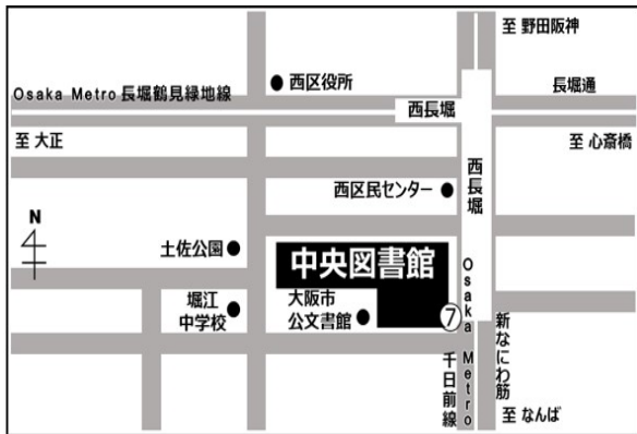
大阪市立中央図書館 大阪市西区北堀江 4-3-2 大阪メトロ 西長堀駅 7号出口すぐ