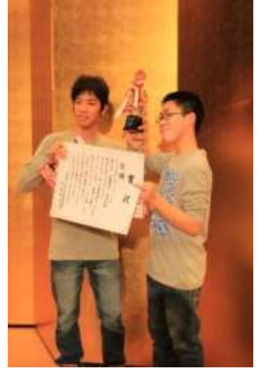
写真：第2回優勝コンビ 「サクリフェイス」