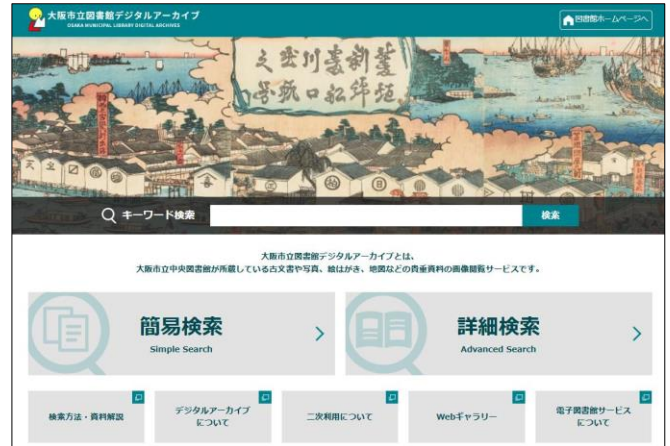
大阪市立図書館デジタルアーカイブトップページ

https://www.oml.city.osaka.lg.jp/index_d.html