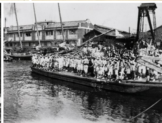
天神祭り夕景(浪花百景)