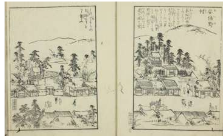
「安倍野村」(『住吉名勝図会 卷之3』より)

WEB「大阪市立図書館デジタルアーカイブ」→「簡易検索」→ 住吉名勝図会 卷之3 より