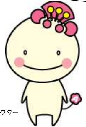
阿倍野区マスコットキャラクター 「あべのん」

この調べかたガイドは、区ごとに2つのことがらを選び、それについて調べるのに役立つ図書館の本や、ホームページで見られる情報を、まとめたものです。