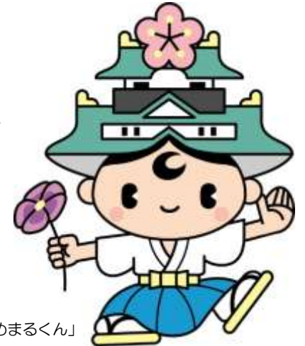
「中央区マスコットキャラクターゆめまるくん」

この調べかたガイドは、区ごとに2つのことがらを選び、それについて調べるのに役立つ図書館の本や、ホームページで見られる情報を、まとめたものです。