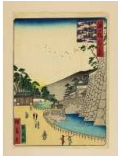
「筋鐘御門」 (『浪花百景』より)