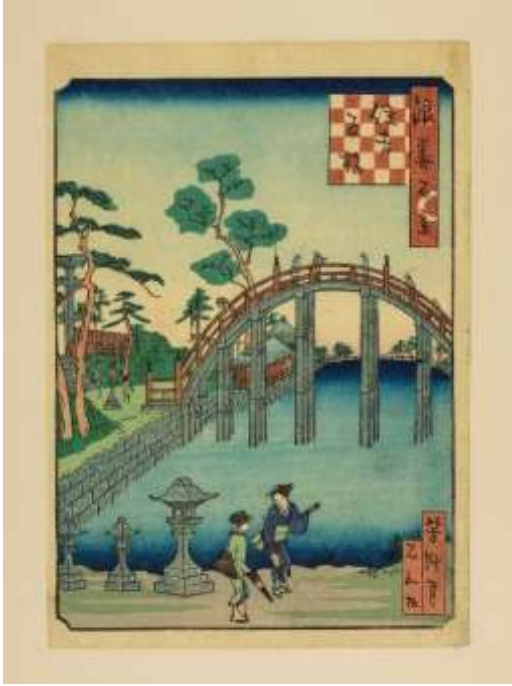
「住吉反橋」(「浪花百景」102枚のうちの1枚より)