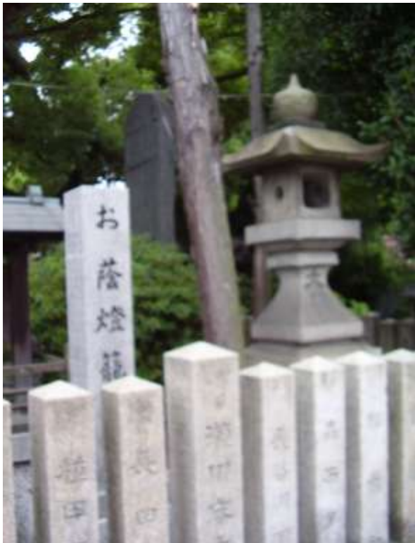
お蔭燈籠

WEB「鶴見図書館」→「鶴見区を知る」→「郷土史よくある質問」→「阿遅速雄(あちはやお)神社のお蔭燈籠について」