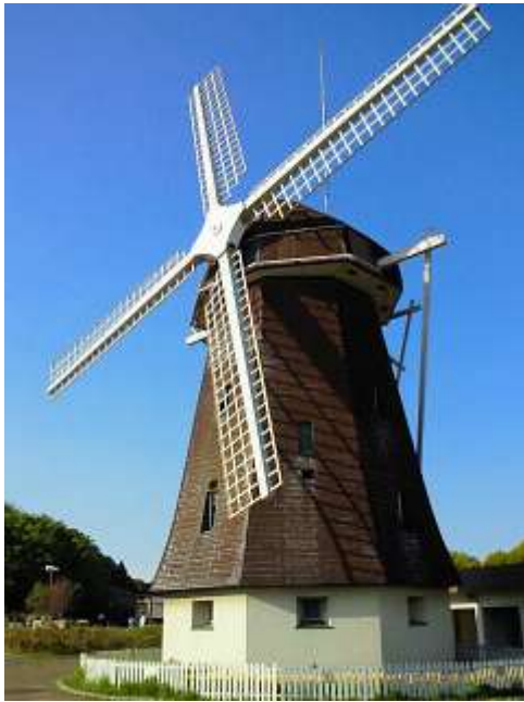
鶴見新山の風車の丘