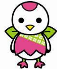
鶴見区マスコットキャラクター「つるりつぶ」