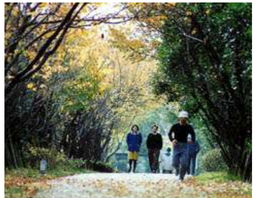
大野川緑陰道路(西淀川区ホームページより転載)