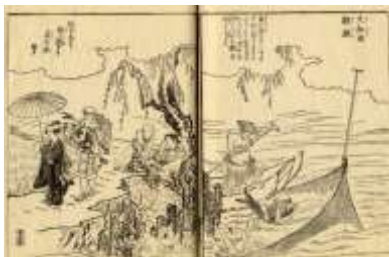
「大和田の鯉つかみ」 (『摂津名所図会 3 東生郡 西成郡』より)

みず ぎよぎょう しごと ひと へ れた水などのため、漁業を仕事にする人は減っていきました。