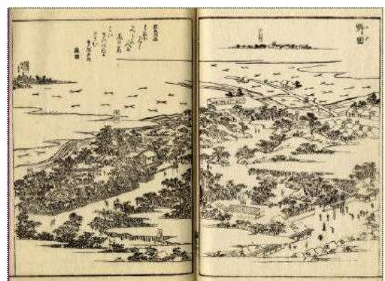
「摂津名所図会 3」より『野田』

https://www.city.osaka.lg.jp/fukushima/page/000000858.html