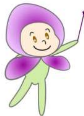
福島区マスコットキャラクター 「フッピー」