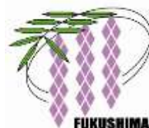
福島区の花 「のだふじ」