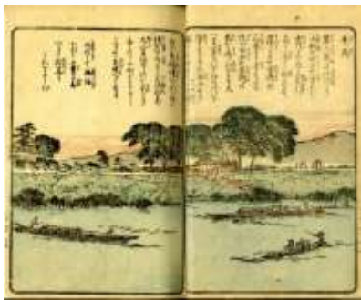
「毛馬」 (『澱川兩岸一覽 上り船之巻 上』より)

おも だ つく はい く し 思い出して作った俳句や詩が、いくつかのっています。