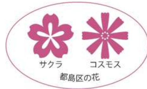
都島区の花 サクラ・コスモス

この調べかたガイドは、区ごとに2つのことがらを選び、それについて調べるのに役立つ図書館の本や、ホームページで見られる情報を、まとめたものです。