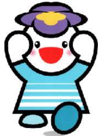
淀川区マスコットキャラクター