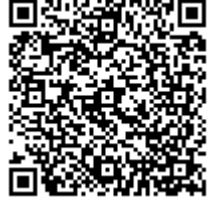
当館 HP お知らせページ

* 申し込み後、図書館からのメールが届かない人は、06-6539-3302 までお問い合わせください。