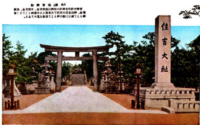
「『大阪』住吉神社」(大阪名所絵葉書[1]より)