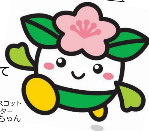
天王寺区マスコット キャラクター ももてんちゃん

この調べかたガイドは、区ごとに2つのことがらを選び、それについて調べるのに役立つ図書館の本や、ホームページで見られる情報を、まとめたものです。