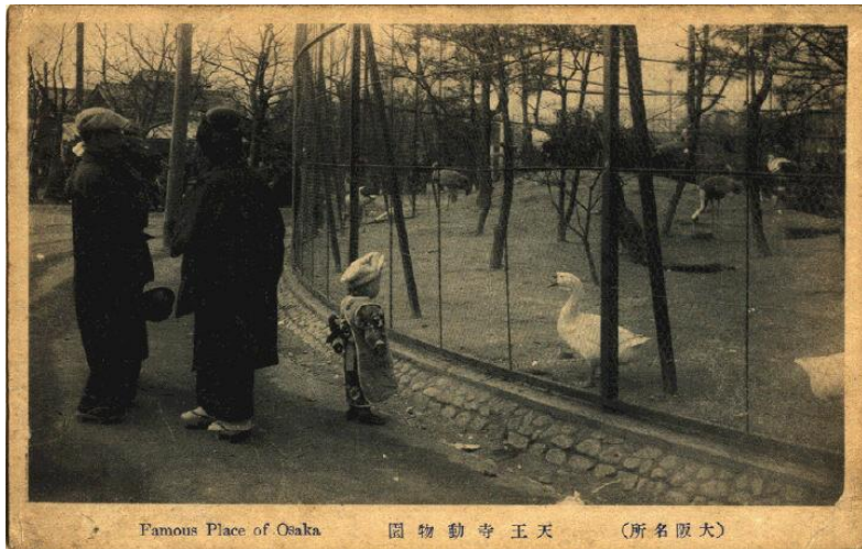
「(大阪名所)天王寺動物園」(『絵葉書』より)

てんのうじどうぶつえん おおさかふりつおおさかはくぶつじょうふぞくどうぶつつかん げんざい 天王寺動物園は、「大阪府立大阪博物館附属動物檻」(現在 ちゅうおうく はいし のち どうぶつ うつ の中央区にあった)が廃止された後、動物を移して、1915 たいしょう ねん がつついたち かいえん たいへいようせんそうちゅう どうぶつ (大正4)年1月1日に開園しました。太平洋戦争中に動物 かず へ ふたた どうぶつ ふ どうぶつえん めんせき ひろ の数が減りましたが、再び動物を増やし、動物園の面積も広 くしました。いま、せいたいてきてんじ やせい どうぶつ く 「生態的展示」という野生の動物が暮ら かんきょう さいげん あたら てんじほうほう かんきょうきょういく す環境を再現した新しい展示方法にするなど、環境教育 ちから い せいき どうぶつえん やくわり も に力を入れ、「21世紀の動物園」としての役割を持っています。