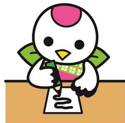
つるみく 鶴見区マスコット キャラクター 「つるりっぷ」