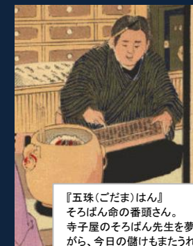
『五珠(ごだま)はん』 そろばん命の番頭さん。 寺子屋のそろばん先生を夢見ながら、今日の儲けもまたうれし。