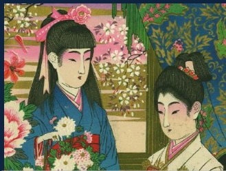
『耽美姉妹』 数々のナイスルッキングガイを虜にしてきたつわもの。愛読書は『春琴抄』 「センターは当然わたくしたちよね」