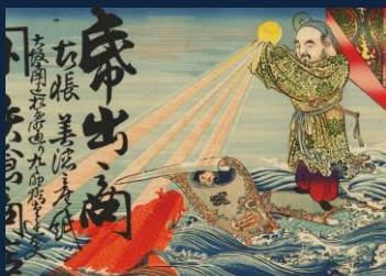
『ゴールデンシップパー』 おれに乗って、世界の海をめぐり、自ら灯台となって世の中を照らし続ける男。お友達は鯉。趣味は釣り。