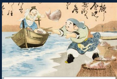
『ざこばのビーチボーイズ』 趣味はビーチバレー。鯛をボールに見立てて、仕事の合間にも訓練を怠らない。 苦しくてスマイルが身上。だって男の子だもん。