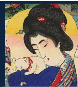
『猫と猫フェチ』名前はまだない。 猫の臭いをかくのが好き。 猫嫌いの旦那に惚れ込み、思い悩み中。