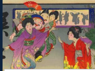
『明治の急愚財流(エグザイル)』 ダンス&ミュージックはわたしたちにおまかせ！ ランニングマンだってきつてできる！...はず。 顔はめバネルも大人気！あなたもはめて、レッツダンシング！