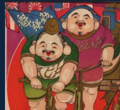
『ちゃりんこ兄弟』 どこまでも裸足で駆け抜ける、仲良し兄弟。 丸い体は、脂肪じゃなくて、筋肉なんですよ。 自転車ブームの昨今、明治から走り続けてきたちゃりんこ兄弟が目玉を浴びる日も近いのか。 「やっと時代が俺たちに追いついてきたな」