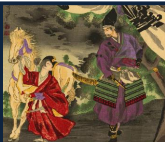
『兄貴と俺』 一目合ったその日から恋の花咲くこともある