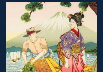
おフランス帰りの『CON・V(こんぶ)』兄妹 富士山をバックに今日も仕事に精を出す、おしゃんな兄とおませな妹。 兄のスカートと妹の鎌がおしゃれポイント。 「コマンタレグー？」