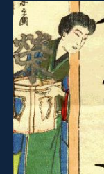
『栄(さかえ)』 繁の同僚。 物陰に潜んで、人の秘密を探るのが趣味。 オフィスラブがばれて、次の仕事を探すなら家政婦と心に決めている。