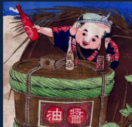
『醤油小僧』 「しょう油は飲み物です！」と言い切るほどのしょう油好き。 「さあ、あなたも一本どうですか」