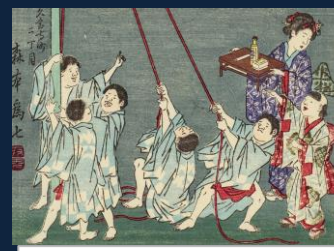
『ニセ松さん』 もちろん、ライバルはO松さん。 ただの悪ガキと思ってなめてはいけない。 センターを取ったら、美形化する日が来るとかないとか。