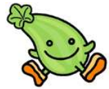
ひがしなりく 東成区マスコットキャラクター 「ういちゃん」