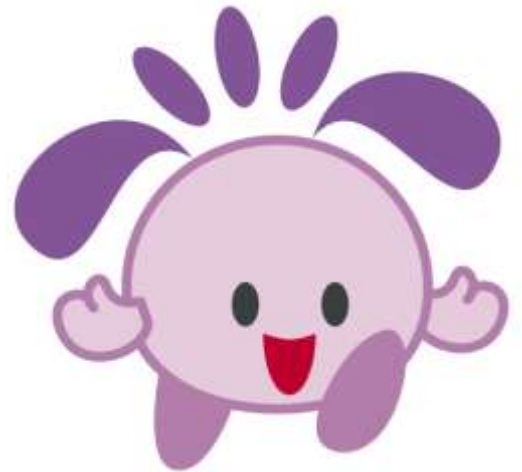
住吉区のマスコットキャラクター すみちゃん

より詳しくお知りになりたいときは、図書館のカウンターへご相談ください。図書館司書がお手伝いします。