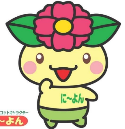
西淀川区マスコットキャラクター に~よん

この調べかたガイドは、区ごとに2つのことがらを選び、それについて調べるのに役立つ図書館の本や、ホームページで見られる情報を、まとめたものです。