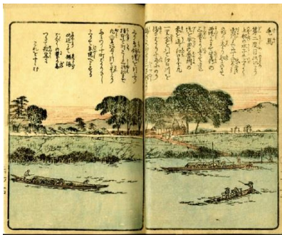
「毛馬」 (『澱川兩岸一覽 上り船之巻 上』より)