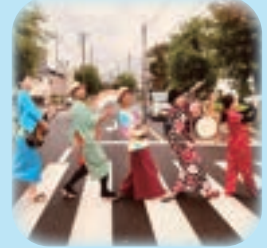
ザ・蜃気楼チンドン一座