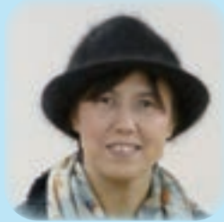
ピーマン みもと てづくり紙芝居館 理事