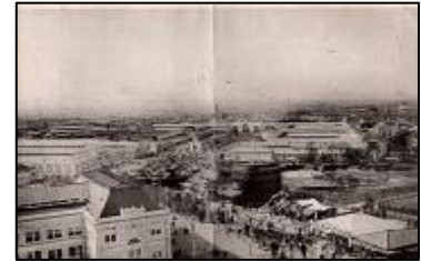
[第五回内国勧業博覧会記念写真]

本や大阪市立図書館デジタルアーカイブの画像プリントアウトから当時の様子を伝えます。