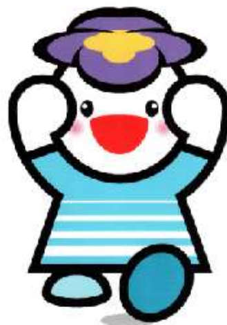
淀川区マスコットキャラクター