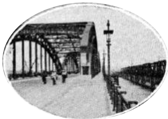
「十三大橋」 (『大阪名所絵葉書』より)

ちゅうごくかいどう なかつがわ わた ばしよ ふる じゅうそう わたし よ 中国街道が中津川を渡る場所には、古くから「十三の渡」と呼 わた ば めいじ ちか むら ひと ばれる渡し場がありました。明治になってはじめて、近くの村の人 じゅうそうばし きばし ご しんよどがわ たちによって十三橋(木橋)がかけられました。その後、新淀川の こうじ すす てつきょう おおさかし おお 工事が進められると、鉄橋にかけかえられました。大阪市が大きく よどがわ きたがわ おおさかし どうろ はし せいび なり、淀川の北側も大阪市になると、道路と橋の整備がすすめら しょうわ ねん じゅうそうおおはし れ、1932(昭和7)年、十三大橋ができあがりしました。5つのアーチ こうぎょう と し おおさか をもつ、工業都市大阪ら はし しいデザインの橋です。