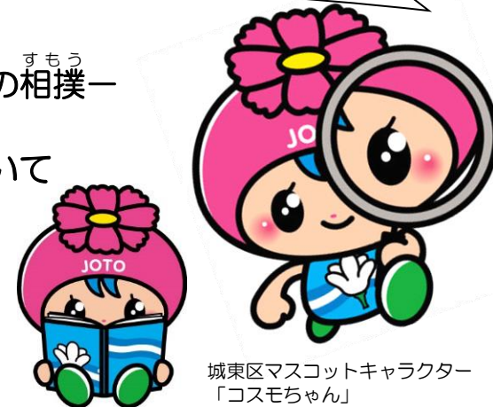
城東区マスコットキャラクター「コスモちゃん」

この調べかたガイドは、区ごとに2つのことがらを選び、それについて調べるのに 役立つ図書館の本や、ホームページで見られる情報を、まとめたものです。