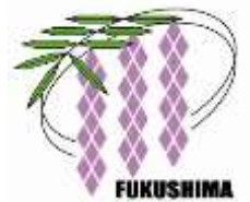
福島区の花 「のだふじ」